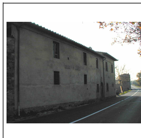
lato sulla strada