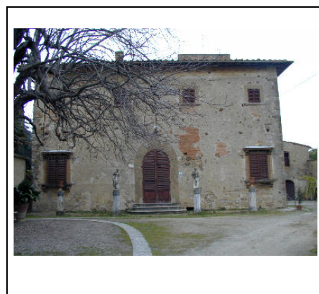
edificio principale: facciata