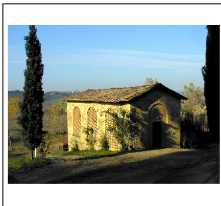
annesso di valore da tutelare