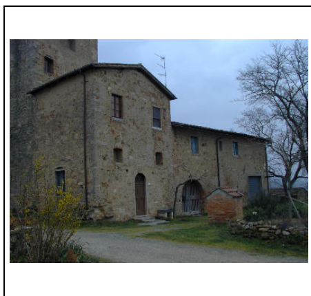
lato sud est ci casa colonica