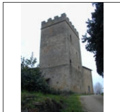
la torre vista da nord