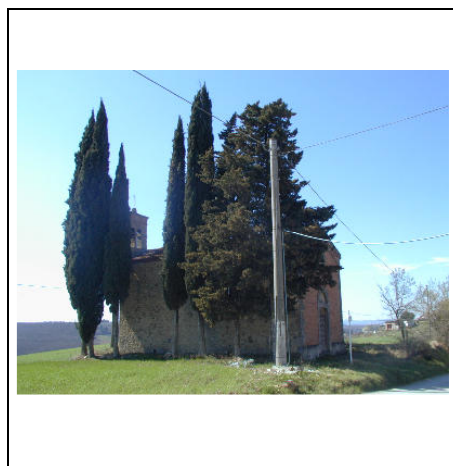
cipressi intorno alla chiesa