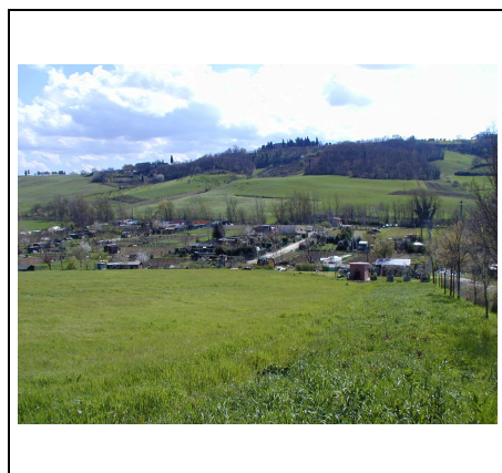
veduta generale dell'area