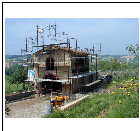
annesso in ristrutturazione