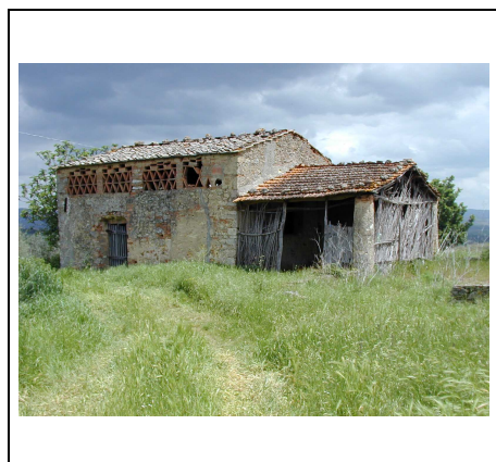
uno degli annessi di pregio