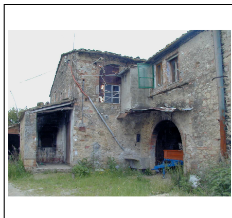
edificio principale lato nord-est