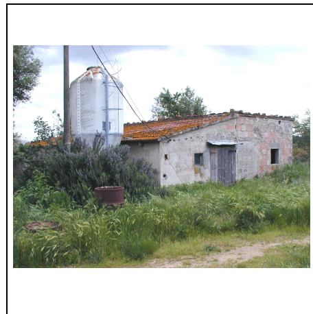
annesso e silos