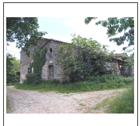
facciata principale con chiesa