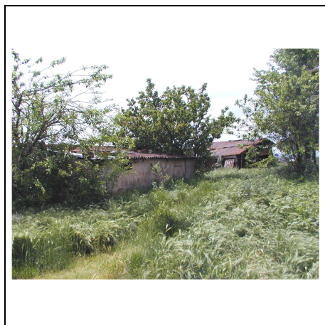
volumi ad uso agricolo