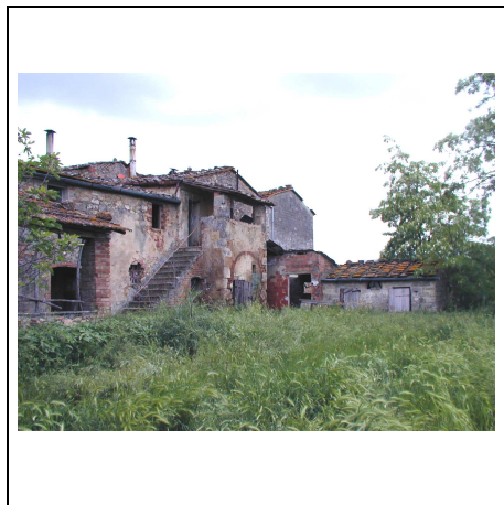
edificio principale lato ovest