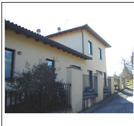
lato su strada