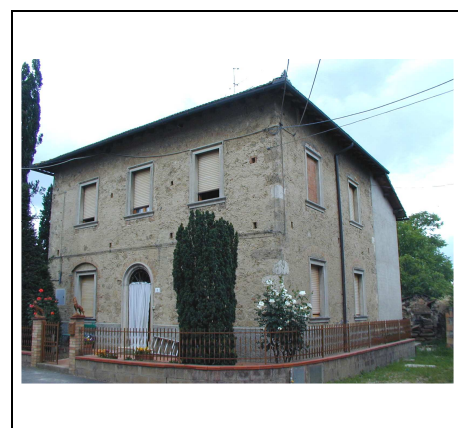
facciata su strada