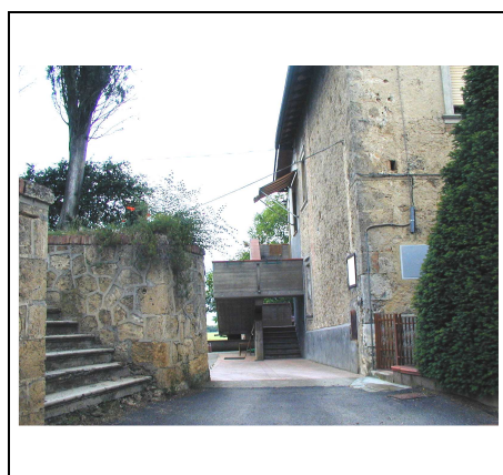
scala esterna in cemento