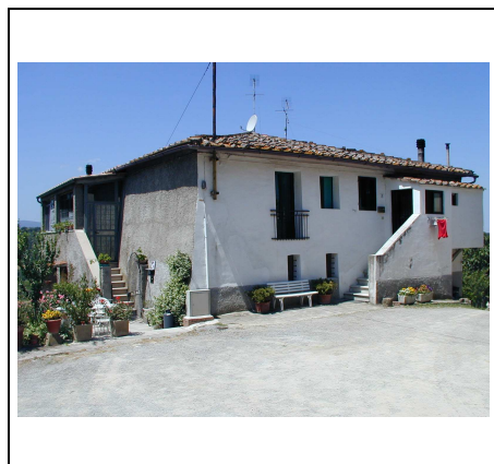
una delle case coloniche