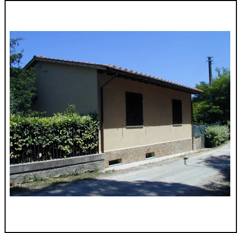
annesso ad uso abitativo