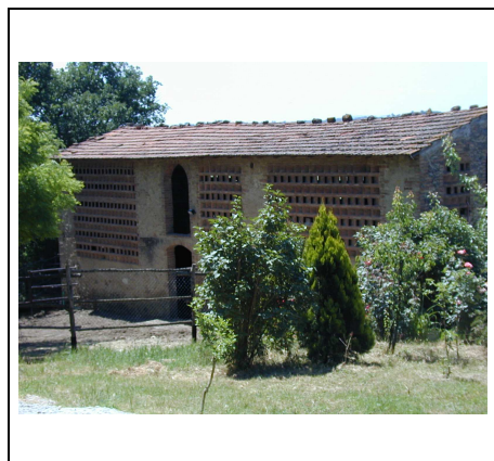
annesso di pregio