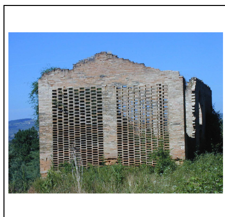
annesso con grigliati