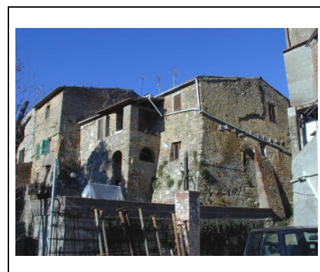
facciata su strada