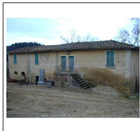
lato sud-ovest con annesso