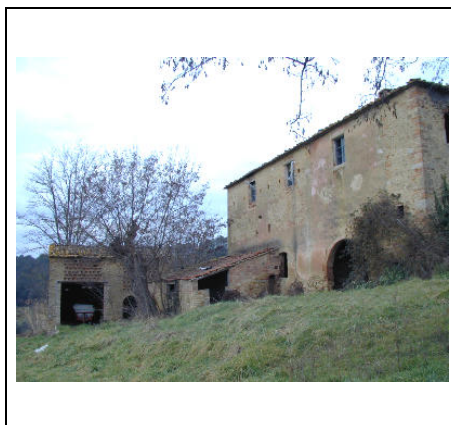
lato sud con annesso