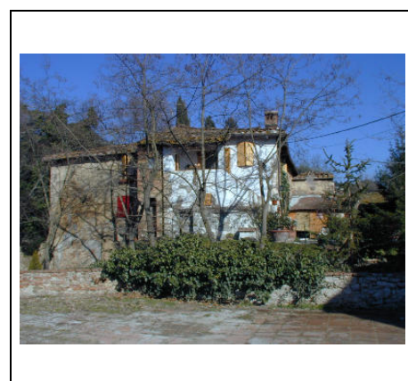
annesso di valore