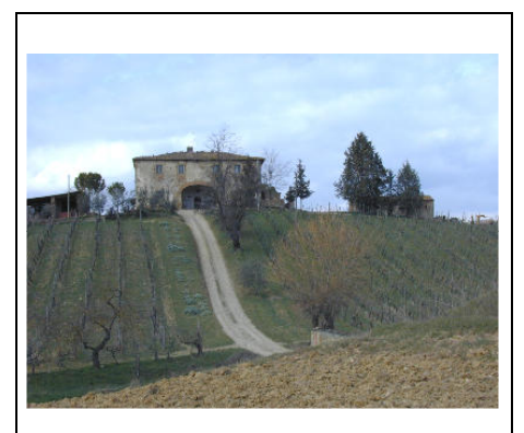
con la strada di accesso.