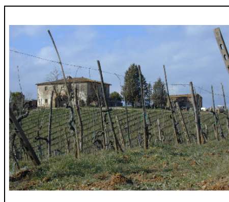
tra le vigne