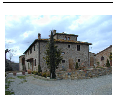
annesso in ristrutturazione