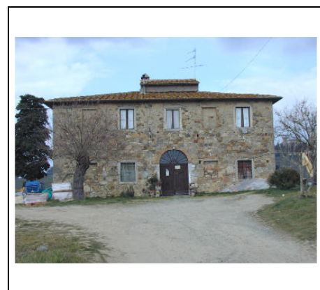
annesso di valore