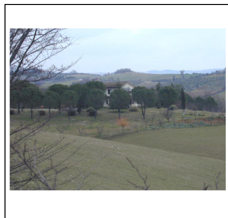
l'edificio vicino alla strada