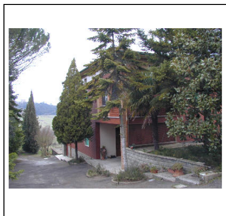
edificio a palazzina