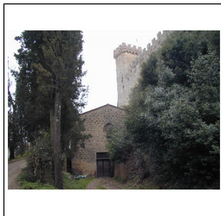
edificio C e Castello