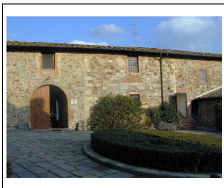
edificio B al centro la parte più antica