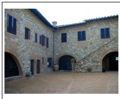
corte dell'edificio A