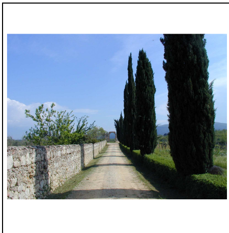
viale di accesso