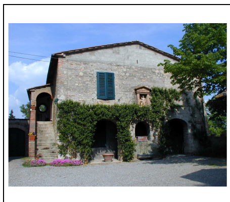
colonica con tabernacolo