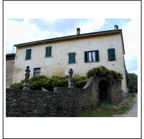
abitazione con giardino