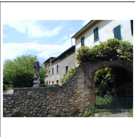
ingresso al giardino