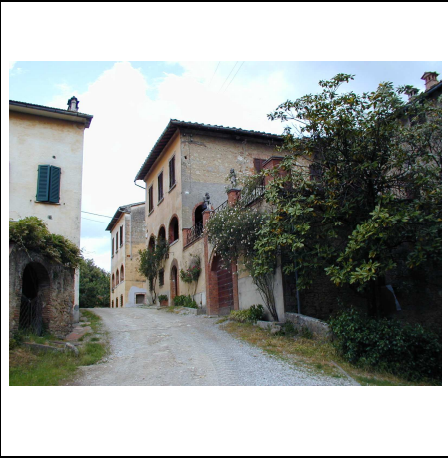
ingresso al nucleo