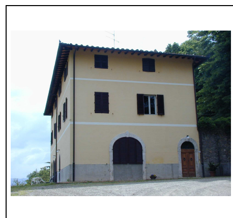
entrata della cantina