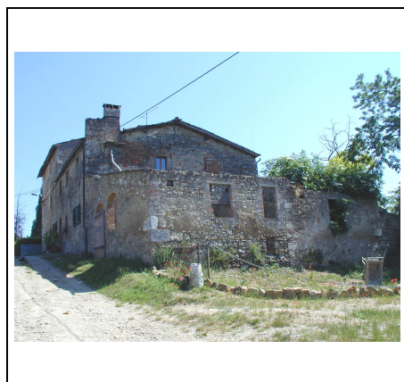
edificio principale con annesso.