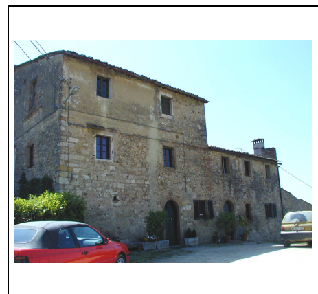
edificio principale lato nord