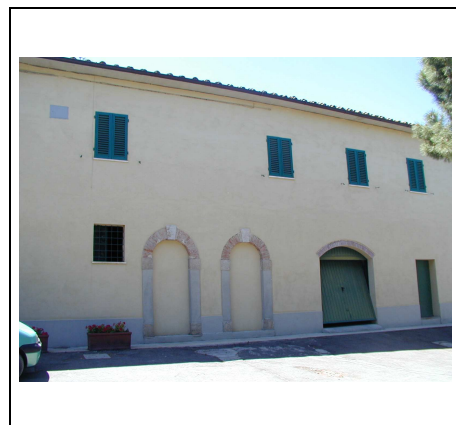
edificio principale lato est