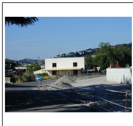
ex annesso agricolo