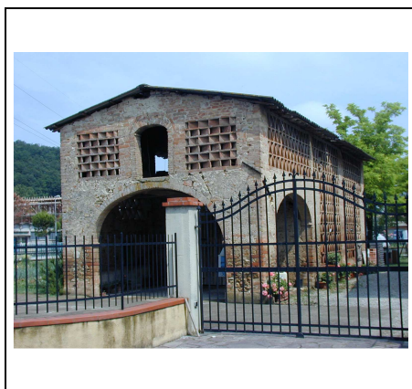
annesso di pregio