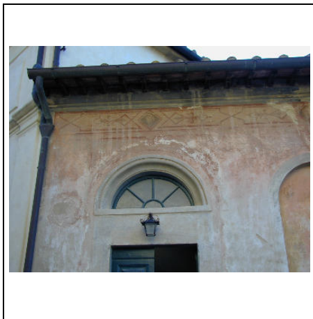
particolare edificio B