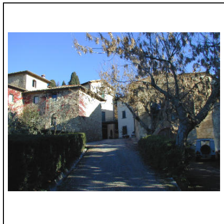
ingresso al nucleo