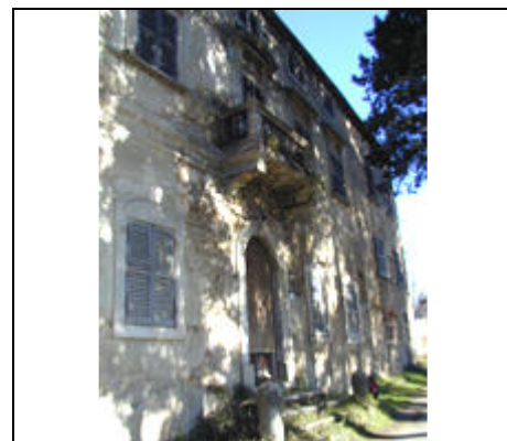
facciata su strada